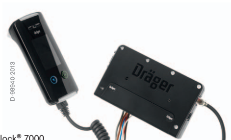
Dräger Interlock® 7000

Alkolåset Interlock 7000 är ett exakt och tillförlitligt instrument. Slå på tändningen på ditt fordon och lämna ett utandningsprov. Om den uppmätta alkohol-koncentrationen i din utandningsluft ligger under det inställda gränsvärdet kan du starta motorn.